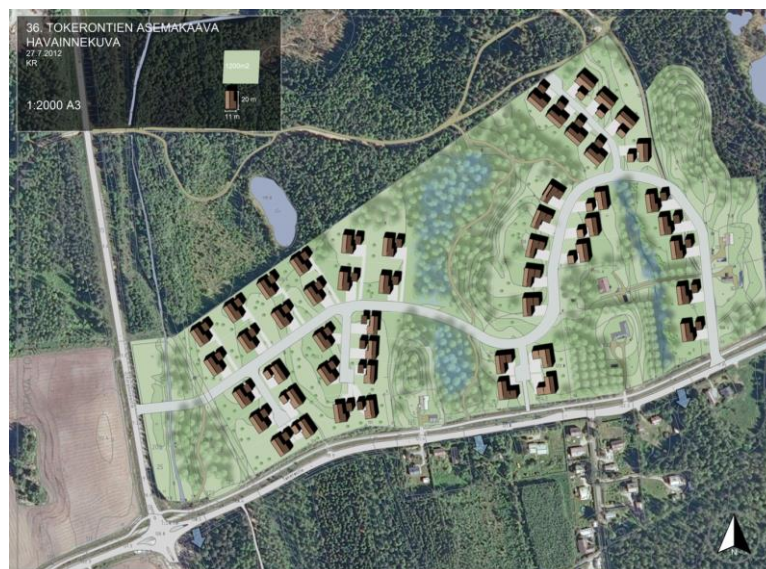
Havainnekuva Tokeron uusista omakotitaloista.

Otavan Tokeroon laadittiin uusi asemakaava jolla mahdollistettiin n. 50 uuden omakotitalon rakentaminen alueelle. Uusi alue suunniteltiin täydentämään olemassa olevaa asutusta ja alueen sisälle jäi muutama vanha kiinteistö, jotka näkyvät kuvassa harmaana. Alue jaettiin kahteen osaan keskellä sijaitsevan alavan ja kostean maaperän takia. Tokeron toteutusaikataulusta ei ole tietoa. Otavan koulutila kaavoitetaan ja sen tuleva toteutus edistää kunnallistekniikan jakamiskustannuksia sekä sitä kautta myös Tokeron toteutusta.