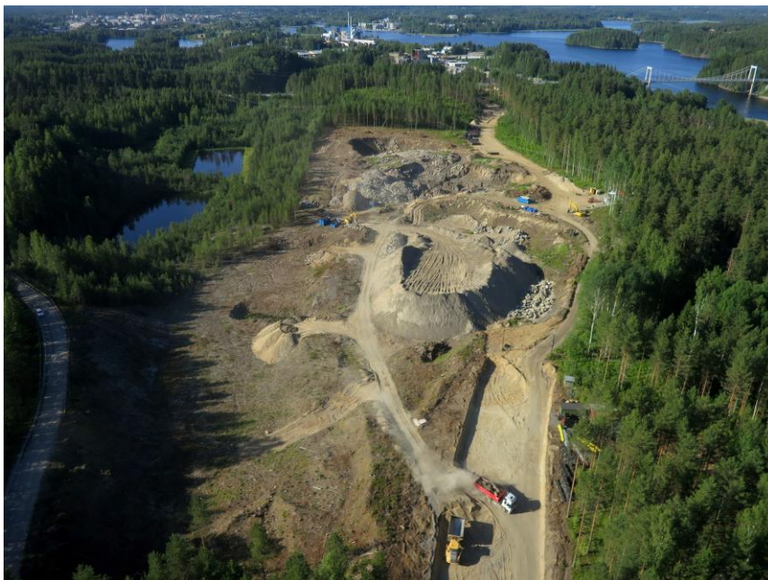
Kirkonvarkauden asemakaava-alue, maankaatopaikan puhdistus

Satamalahden digitaalisen ja ekologisen kaupunginosan suunnittelu etenee yleiskaavoituksen, asemakaavoituksen ja maanhankinnan kautta.