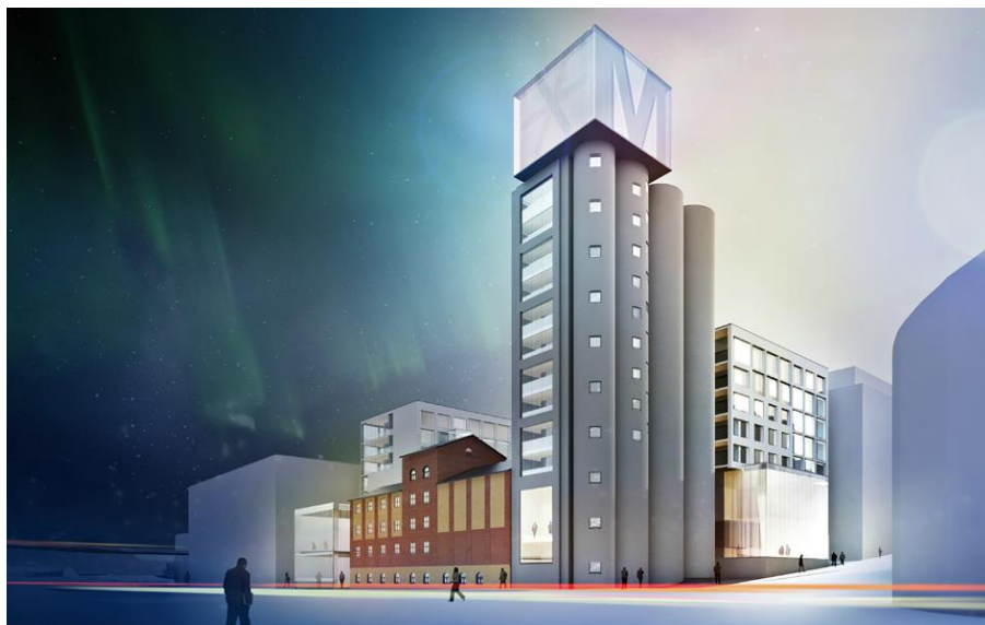
Kuvat: Arkkitehtitoimisto C&J, siilojen huipulla oleva kuutio on teknistä tilaa. Museon sisäänkäynti on Raatihuoneenkadun puolella, sen yläpuolella on kerrostalo. Taustalla palvelutalo.