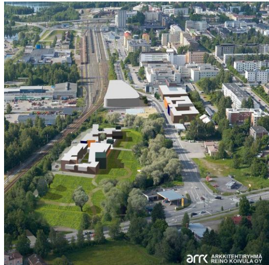
Havainnekuva keskussairaalan laajennuksista, ARRK (Arkkitehtiryhmä Reino Koivula Oy)